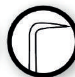
Gancho con ángulo de 90°