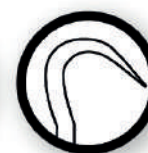
Gancho con ángulo de 180°