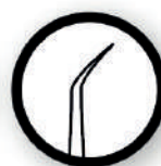
Gancho con ángulo de 35°